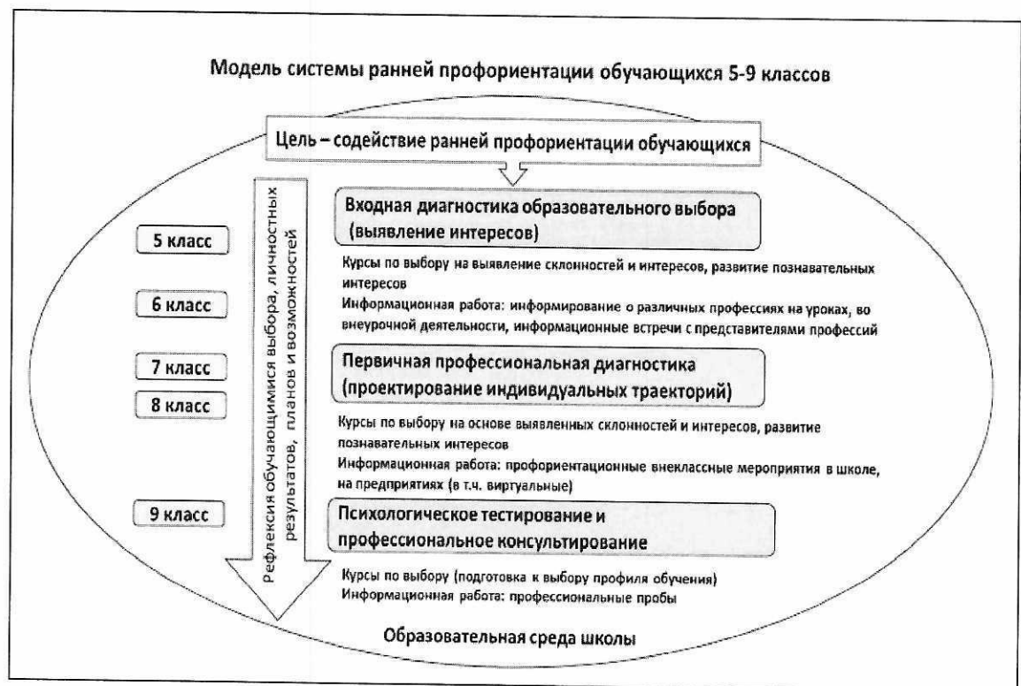
Схема 3. Модель системы ранней профориентации обучающихся 5-9 классов

Схематически модель системы ранней профориентации может быть изображена следующим образом (схема 3):