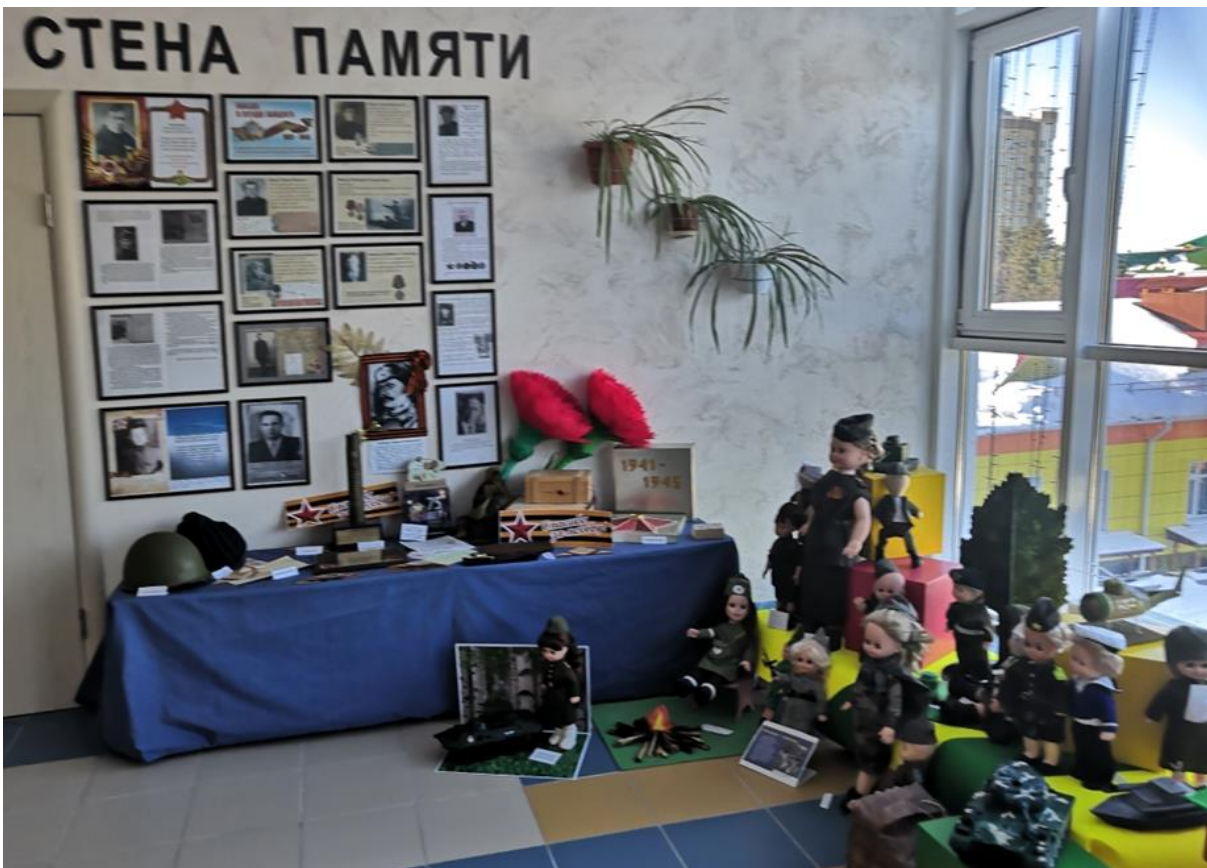
Рис. 14. Творческий конкурс «Кукла в военной форме»