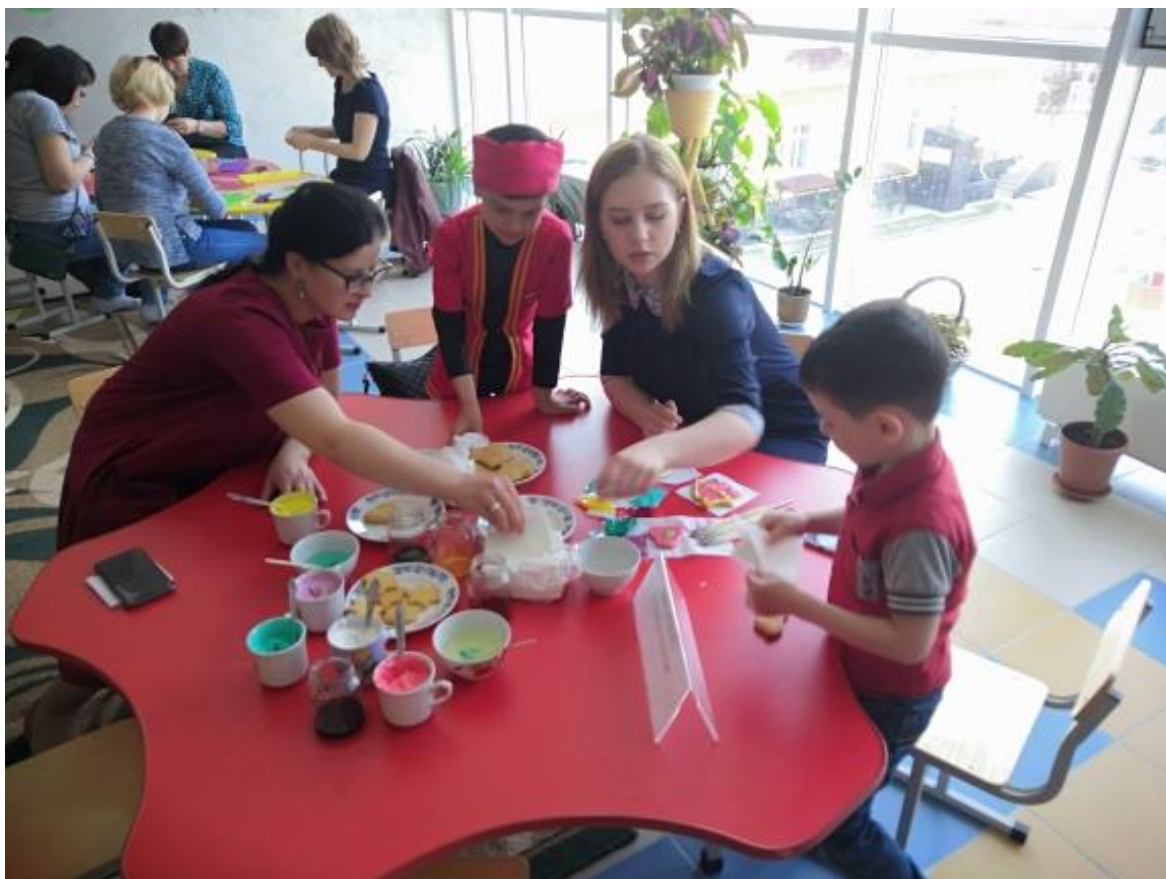
Рис. 8. Мастер-класс «Мастера и рукодельницы»

В своей работе с родителями, мы не редко обращаемся к инструментарию программы «Социокультурные истоки», даже в наших традиционных мероприятиях. Так во время круглого стола «Мой ребёнок меня не слышит» мы используем материал из книг «Радость послушания», на традиционной конференции по питанию – вспоминаем о семейных традициях, «Фестиваль талантливых родителей» не обходится без мастерских мастеров и рукодельниц и т.д. (рис. 8) Приятно радуется, что некоторые из проводимых нами тематических мероприятий, стали традиционными, получив положительные отзывы родителей. (рис. 9 -11)