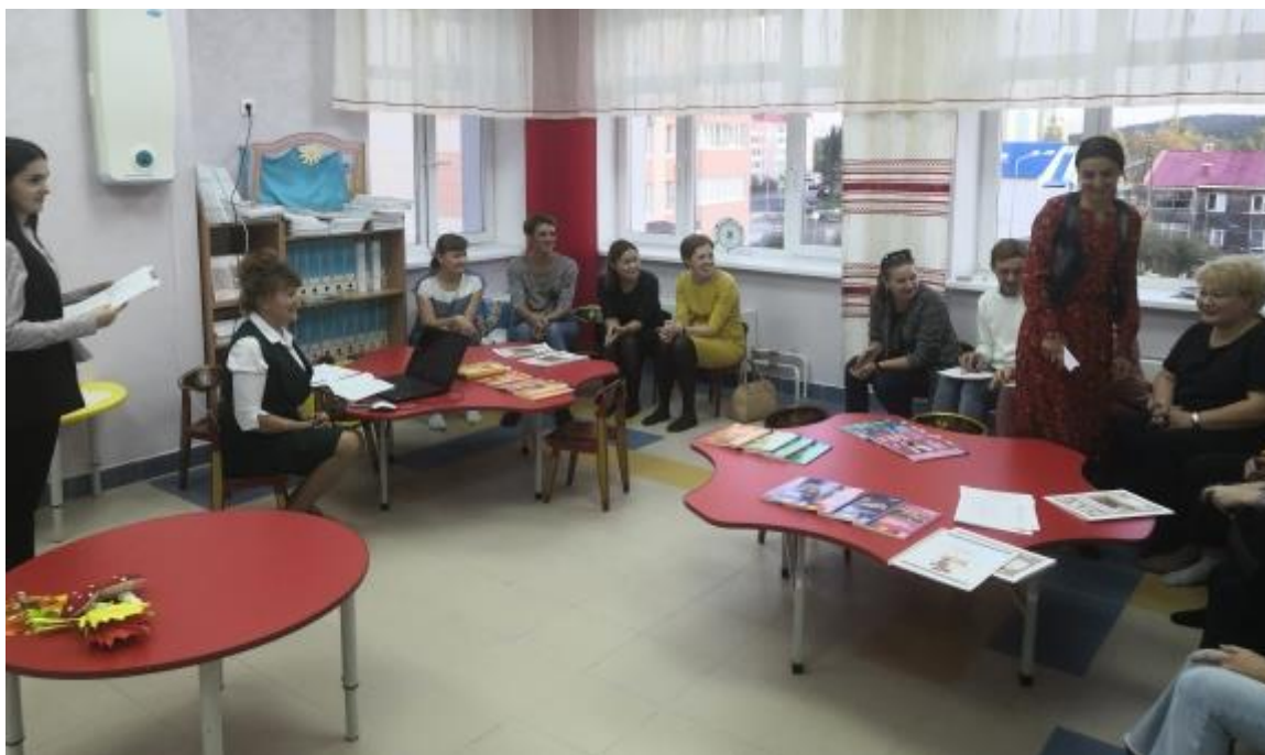
Рис. 6. Родительское собрание в группе старшего дошкольного возраста 6-7 лет)

Сегодня уже ни у кого не вызывает сомнения то, что воспитание гармонично-развитой и социально ответственной личности возможно только в сотрудничестве образовательной организации с семьями обучающихся. Уже на первом родительском собрании, мы знакомим родителей с тем инструментарием, который используют наши педагоги в работе с дошкольниками. (рис. 6)