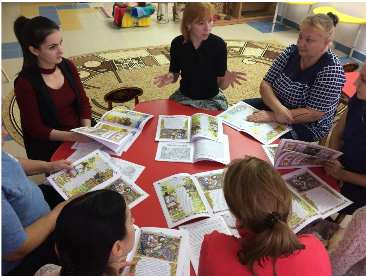
Рис. 7. Мастер-класс с педагогами, перед началом работы над новой темой

Работа над каждой новой темой, начинается с мастер-класса для воспитателей. Мероприятия, на котором педагоги обсуждают тему и инструментарий. (рис.7) Прежде чем начать работу с детьми и родителями, педагогу необходимо самому изучить тему, проникнуться и осмыслить её содержание.