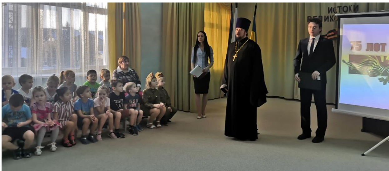
Рис. 12. Открытие Фестиваля «Истоки Великой Победы»

Одним из проявлений любви к Родине и преданности ей у взрослого человека является готовность встать на ее защиту, чему немало примеров в истории нашей страны. Военная история России полна героизма, романтики, истинного патриотизма, насыщена интересными, драматическими событиями, представлена удивительными, уникальными личностями. Всё это обеспечило богатейший материал для подготовки и реализации проекта «Истоки Великой Победы». Нам и нашим детям есть чем гордиться, на кого равняться. У нас нет права забывать нашу историю, наши истоки. Отмечая памятную дату – 75 лет со дня Великой Победы народов нашей многонациональной Родины в Великой Отечественной войне, победы, доставшейся стране ценой великих подвигов и невероятных потерь, в нашем городе стартовал Фестиваль «Истоки Великой Победы». Целью которого было объединение всех заинтересованных сторон в воспитании патриотизма подрастающего поколения, деятельном служении Отечеству, сохранении памяти, укреплении традиций и связи поколений. Открытие Фестиваля в нашем учреждении стало по настоящему значимым и торжественным событием. (рис. 12)