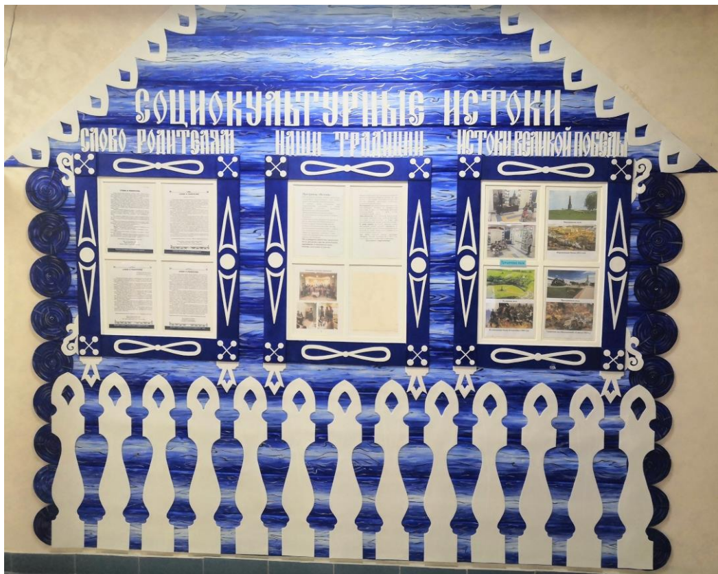
Рис.3. Информационный центр для родителей