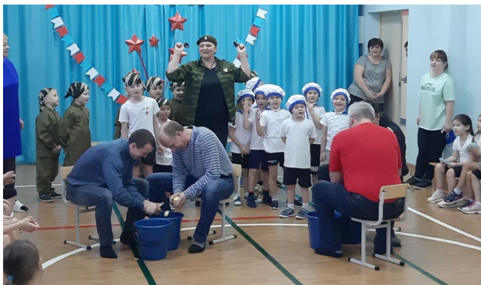
Рис.10. Мероприятие «Кузьминки»