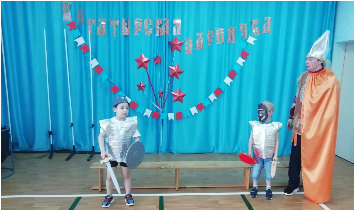
Рис. 13. «Богатырская зарничка»