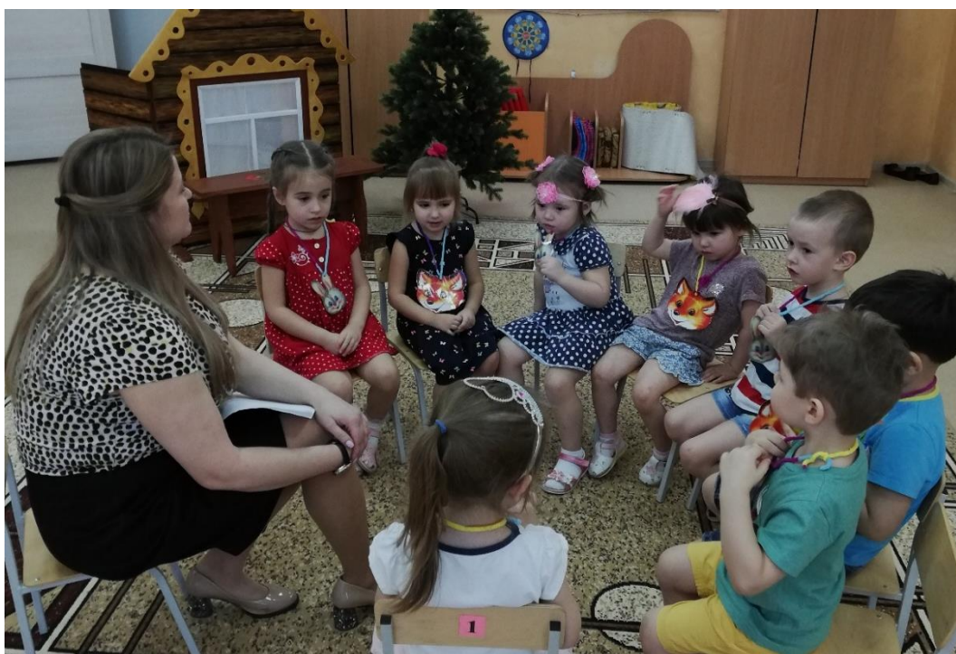
Рис. 5. Активное занятие с детьми младшего дошкольного возраста 3-4 года

Опыт педагогов нашего образовательного учреждения показывает: дети с интересом и какой-то особой жадностью слушают слова о любой добродетели, о чести, о совести. (рис.5) Они, как сухая земля влагу впитывают рассказы о благородных поступках, доблестных подвигах тех, кто жил на нашей земле раньше. Всё это формирует человека. Причем, если ребёнок стремится к добру, а в семье ему все эти вещи не объясняют, не говорят о тех базовых нравственных принципах, то возможно услышанное от педагога поможет ребёнку вести себя иначе, чем родители.