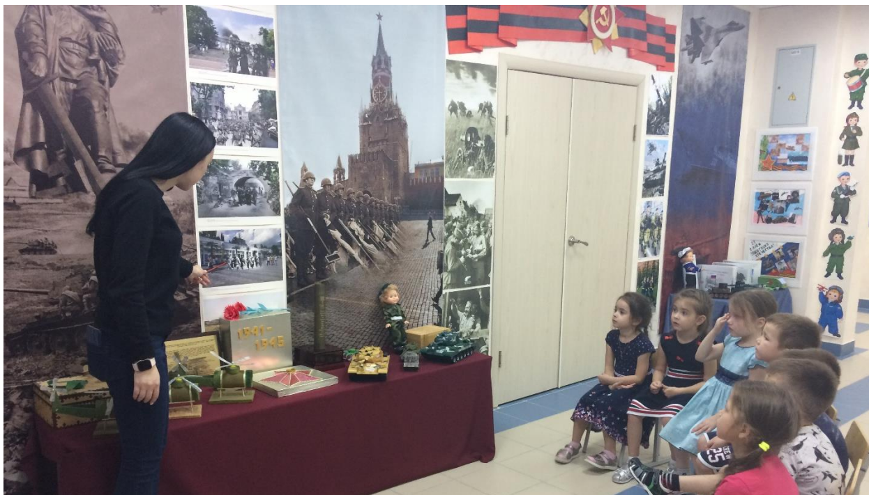
Рис. 15. Тематическое занятие с детьми старшего дошкольного возраста 5-6 лет

На базе нашего образовательного учреждения, в рамках фестиваля «Истоки Великой Победы», проходил городской конкурс среди дошкольных образовательных организаций г. Ханты-Мансийска «Кукла в военной форме». В мероприятии приняли участие все дошкольные образовательные учреждения города. Выставка проводилась в онлайн формате, профессиональное жюри дистанционно оценили 54 конкурсные работы.