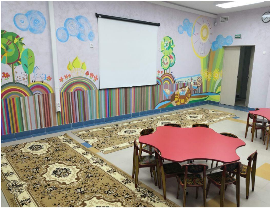
Рис. 1. Кабинет истоковедения