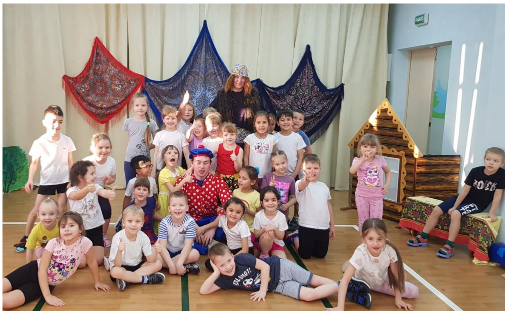
Рис. 9. Мероприятие «Чаепитие в Русских традициях»